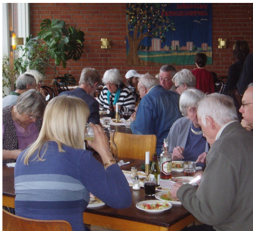
Matsalen är den dagliga träffpunkten

Antalet matgäster per dag är 25-50. Fredagarna är populärast. Då är det fest.